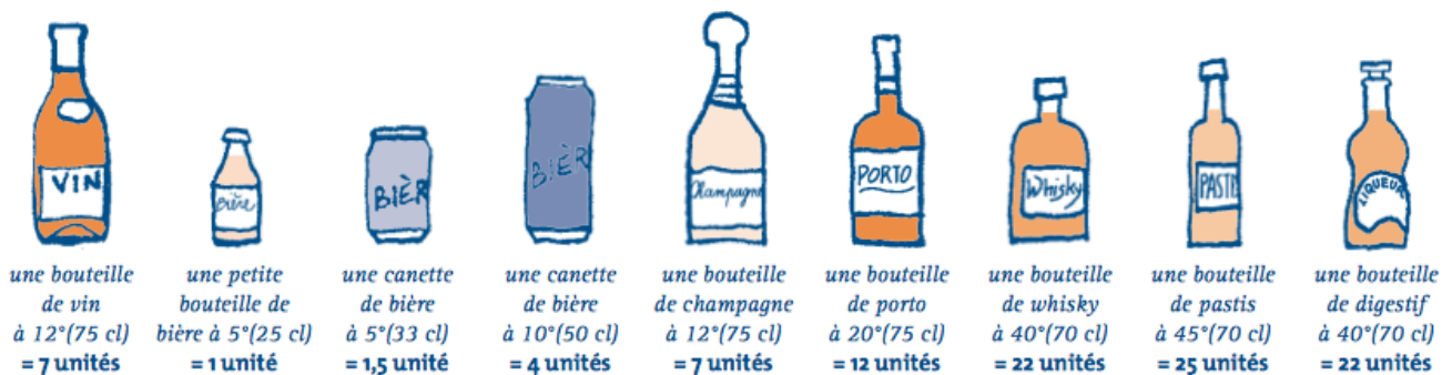
Tableau des équivalences en bouteilles

Voir chapitre 2.2.1. pour un tableau des équivalences détaillé.